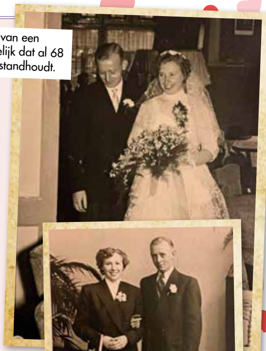
Foto van een huwelijk dat al 68 jaar standhoudt.