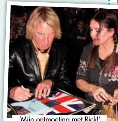
'Mijn ontmoeting met Rick!'