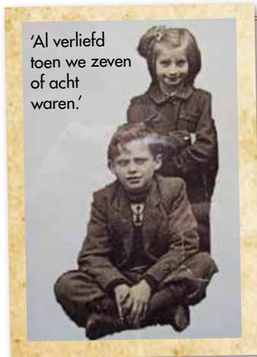
'Al verliefd toen we zeven of acht waren.'

Bijna iedereen herinnert zich de allereerste keer dat hij of zij echt verliefd werd nog goed. De mengeling van opwinding, kwetsbaarheid en ontdekking. Maar wat maakt die eerste romantische ervaring zo bijzonder? Wij vroegen het aan een aantal lezers van MAX Magazine.